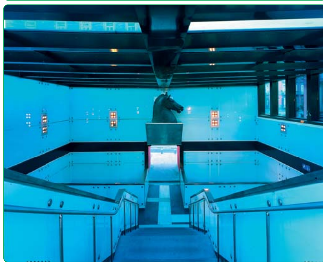
Fig. 3 - Alcune opere d'arte presenti nelle stazioni della metropolitana di Napoli.