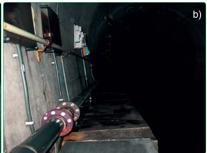
Fig. 11 - Lo stato del tunnel: a) prima dell'intervento b) dopo l'intervento