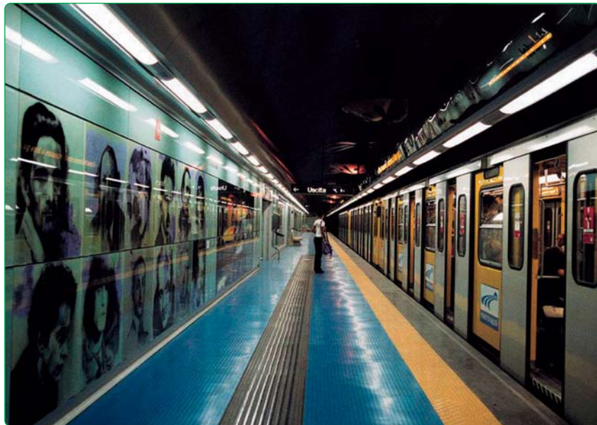
Fig. 2 - Metropolitana di Napoli - Banchina stazione Materdei

Tutte queste considerazioni hanno motivato la Direzione