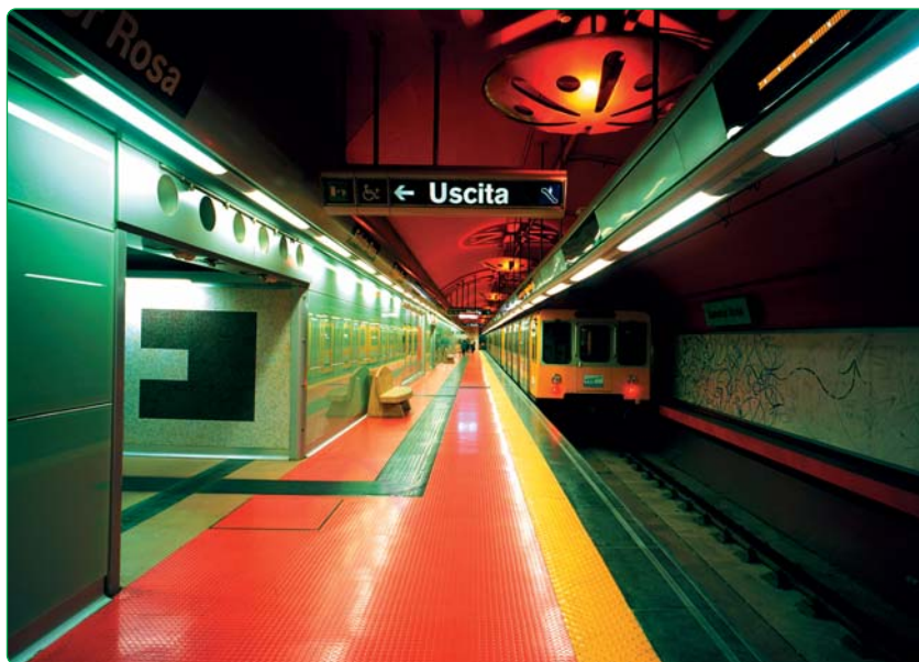
Fig. 1 - Metropolitana di Napoli, banchina stazione Salvator Rosa

All'interno dei tunnel ferroviari si presentano situazioni di criticità derivanti dalla eccessiva presenza di polveri grossolane e sottili. Queste si producono continuamente al passaggio dei convogli per le numerose interazioni da contatto