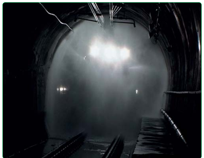
Fig. 10 - Fase di scopatura idrica a 360° del tunnel mediante abbondante acqua a pressione