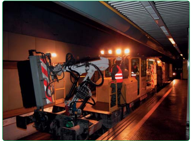
Fig. 8 - Il sistema Tecnofer "Salt Pony" predisposto per la pulizia delle gallerie di Metronapoli

lo attrezzato con spazzole e impianto di abbattimento ad acqua delle polveri prodotte (ved. figg. 8 e 9), per la spazzolatura meccanica delle pareti, della segnaletica e di parte della volta,