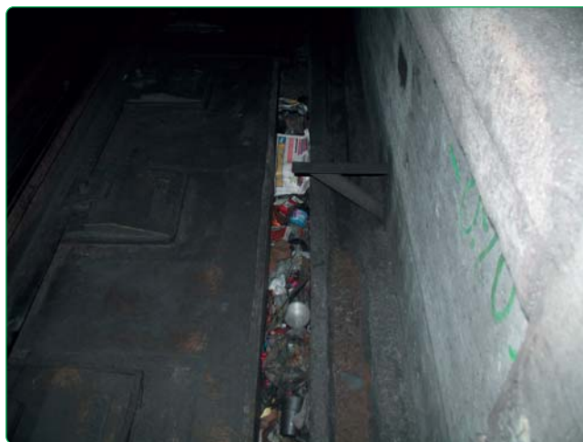
Fig. 6 - Macro sporco presente prima dell’intervento sotto la platea del binario

La seconda prevede l’impiego di un convoglio semovente denominato “ Salt Pony ” composto da un motocarrel-