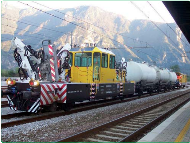
Fig. 7 - Il sistema automatizzato per il lavaggio dei tunnel ("salt 400") utilizzato nella rete RFI