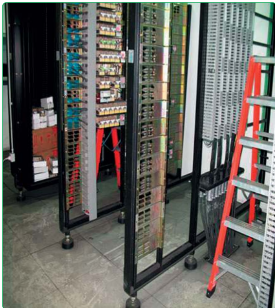
Fig. 4 - Sala relè con polveri presenti sul pavimento

Questo sistema (ved. fig. 7), ideato e costruito dalla Soc. Tecnofer di Mantova, era stato dimensionato per la pulizia delle gallerie ferroviarie delle linee nazionali che hanno la sagoma limite superiore rispetto a quella delle linee metropolitane.