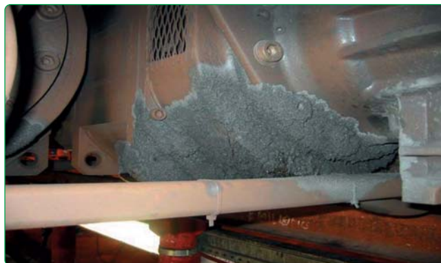
Fig. 5 - Il motore di un veicolo di trazione con incrostazioni

Parimenti, le polveri sottili adesivate alle pareti, non sono facilmente aspirabili se non rimosse anch’esse da una spazzolatura meccanica (ved. sistema robotizzato nel precedente capitolo).